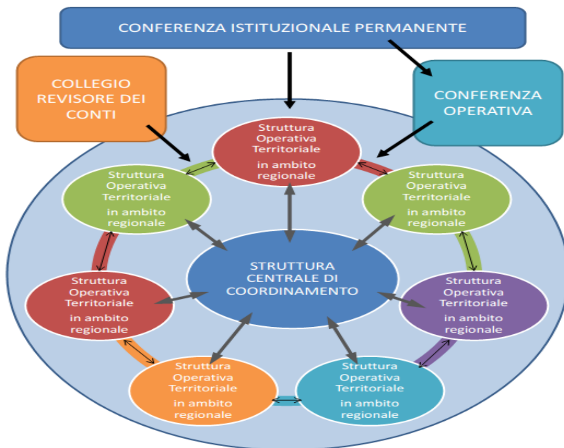
Figura 2: Organizzazione istituzionale-tecnico-operativa dell'Autorità di Bacino Distrettuale dell'Appennino Meridionale

con sede presso immobili messi a disposizione dalle rispettive Regioni, “ configurazione ” strettamente intercorrelata ed “improntata” sull’efficienza ed efficacia del percorso di pianificazione e programmazione e sulle ricadute in termini di “governo territoriale” (fig. 2).