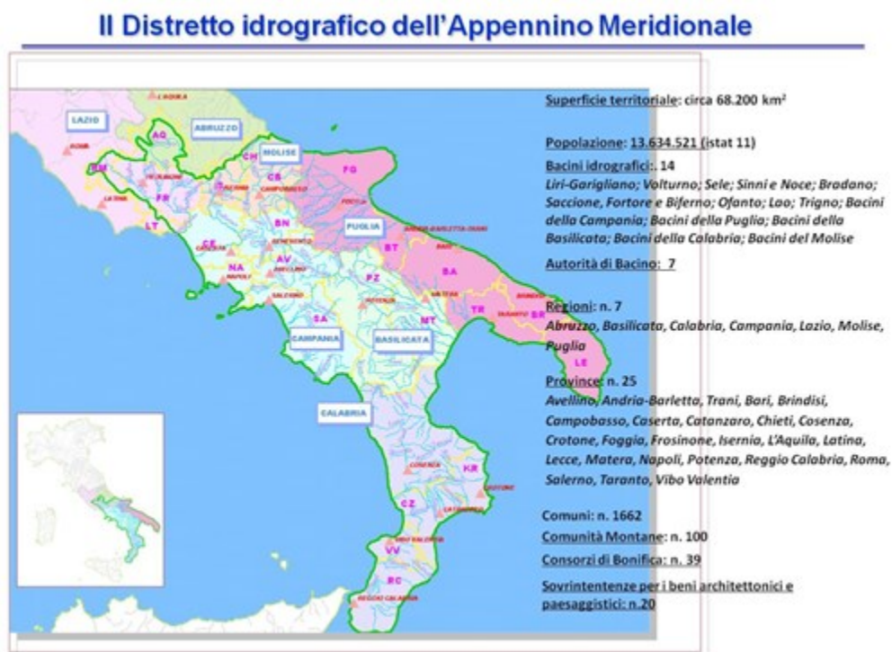
Figura 1: Configurazione del Distretto Idrografico dell'Appennino Meridionale

Nei paragrafi seguenti, vengono riportate le attività svolte nell'anno 2019 rinviando alla relazione dell'anno precedente per un inquadramento delle attività svolte negli anni addietro, che costituiscono piattaforma nella quale si “ancora” il lavoro oggetto del presente documento.